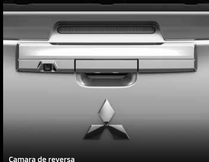
Camara de reversa