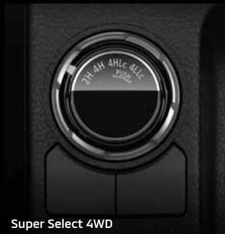
Super Select 4WD