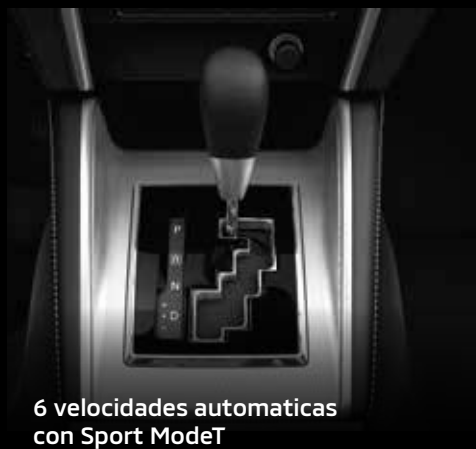
6 velocidades automaticas con Sport ModeT