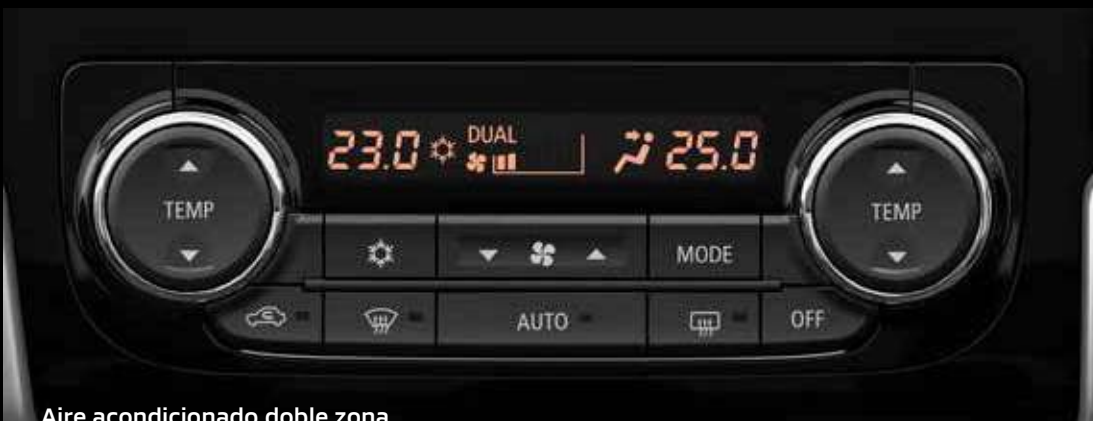
Aire acondicionado doble zona