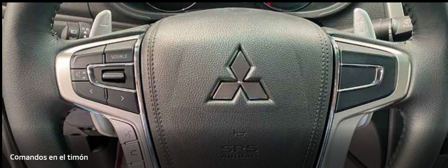
Comandos en el timón