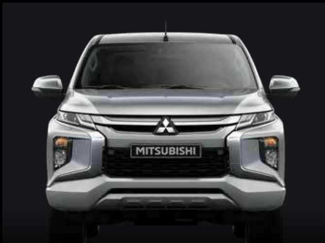
Diseño frontal (Dinamic Shield)