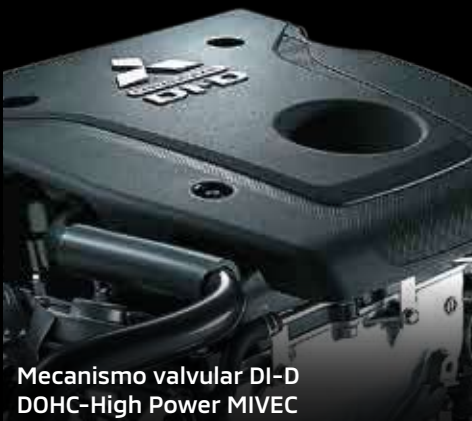
Mecanismo valvular DI-D DOHC-High Power MIVEC