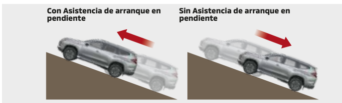
ASISTENCIA DE ARRANQUE EN PENDIENTE

Regula independientemente la fuerza de frenada durante las curvas para ayudar a mantener la estabilidad del vehículo, siempre que sea necesario.