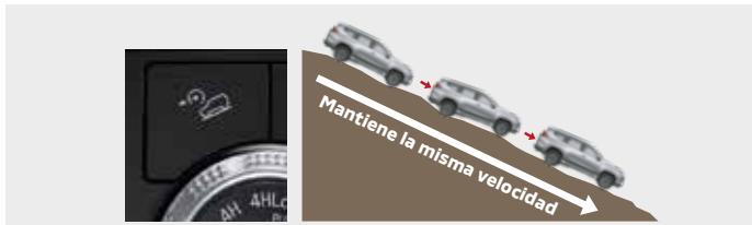
CONTROL DE DESCENSO EN PENDIENTES [HDC]

El cuerpo contorneado, resistente y aerodinámico, contribuye a un manejo sólido y de alto rendimiento brindándole máxima estabilidad en la carretera. La confiable tracción 4WD se combina con una suspensión avanzada para mantenerlo en contacto con diferentes condiciones de las superficies, logrando un control firme.