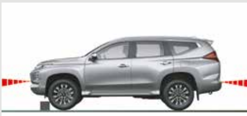
SISTEMA ULTRASÓNICO DE MITIGACIÓN DE ACELERACIÓN POR ERROR (UMS)