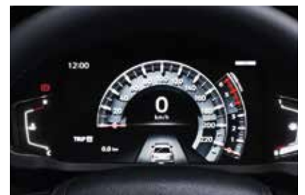
PANTALLA DE INFORMACIÓN MÚLTIPLE LCD A COLOR DE 8"