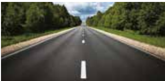
Para condiciones normales de la carretera.